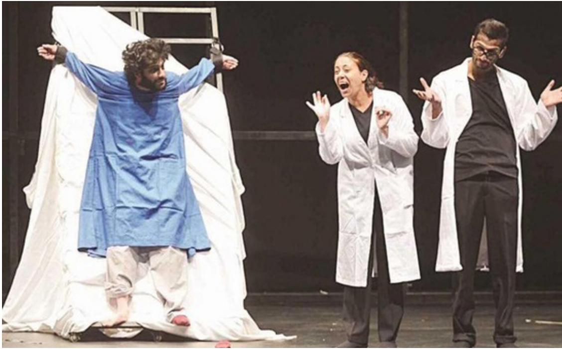
مسرحية بلا غطاء - لفرقة مسرح الخليج العربي

والفنون والآداب دورة هذا العام من المهرجان الدولي للموسيقى والذي يهدف إلى الاحتفال بيوم الموسيقى العالمي والذي تحتفل به دول العالم كل عام في شهر يونيو، وتضمن برنامج المهرجان هذا العام 8 فعاليات موسيقية وغنائية منها 4 كويتية و4 أجنبية. كما استضاف المجلس الوطني للثقافة والفنون والآداب وبالتعاون مع الهيئة العربية للمسرح ومقرها إمارة الشارقة بدولة الإمارات العربية المتحدة الدورة 8 لمهرجان المسرح العربي والتي تقام كل سنتين في عاصمة عربية وذلك