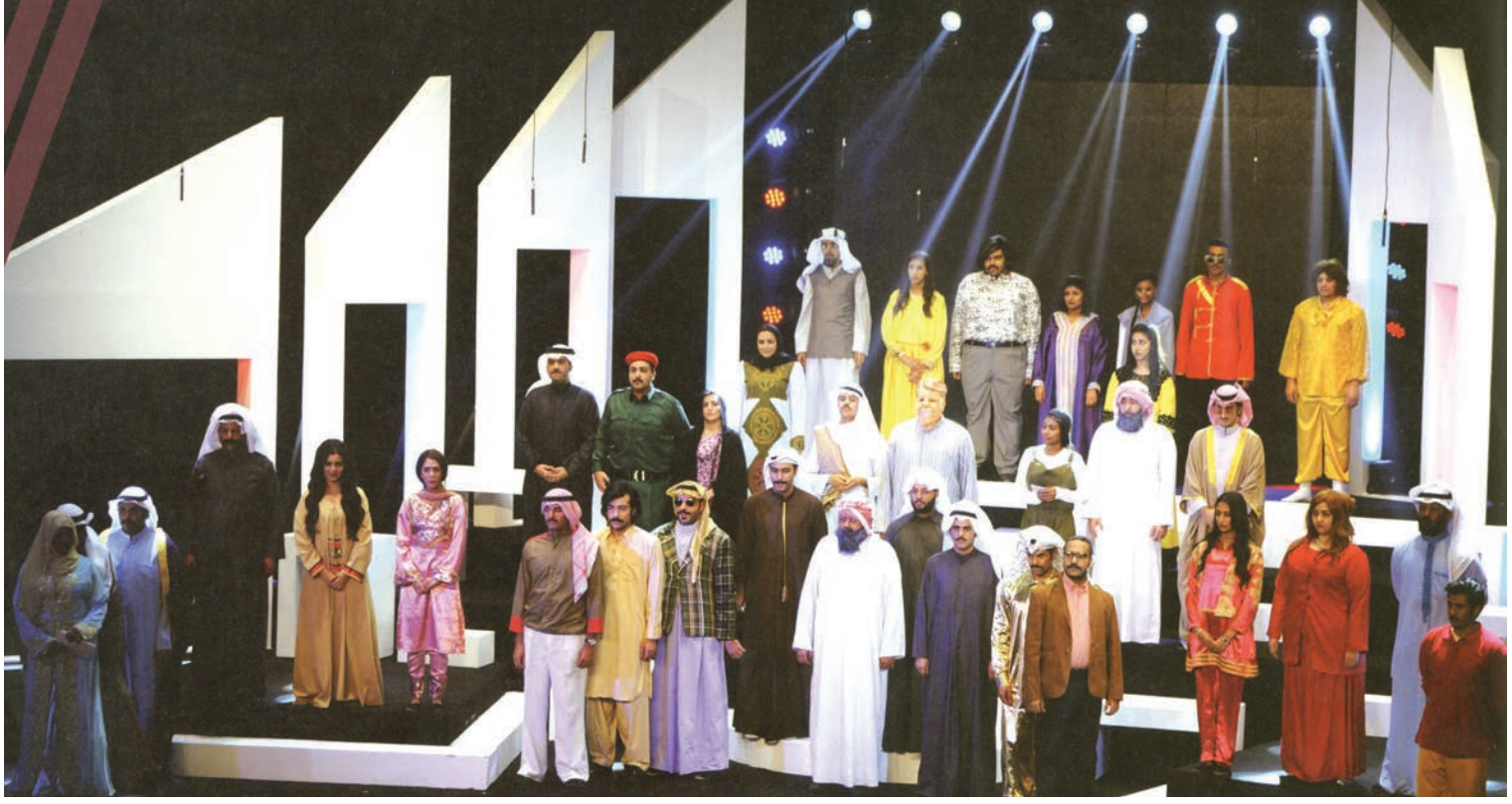
حفل افتتاح مهرجان القرين الثقافي واحتفالية الكويت عاصمة للثقافة الإسلامية - يناير 2016

و فرقة الإنشاد الديني التابعة لهيئة قصور الثقافة بوزارة الثقافة المصرية. ويغطي التقرير، نصف السنوي للمجلس الوطني للثقافة والفنون والآداب خلال الفترة من يناير إلى يونيو من العام الحالي متضمنا احتفالية الكويت عاصمة الثقافة الإسلامية 2016 بترشيح من المنظمة الإسلامية للتربية والعلوم والثقافة (إيسيسكو)، كل الأنشطة والفعاليات التي أقيمت خلال هذه الفترة، ويشير إلى إقامة 22 معرضا تشكليا من ضمنها المعارض السنوية المقررة ومعارض شخصية لفنانين كويتيين وآخرين من خارج الكويت من العرب والأجانب. كما يشير إلى معارض الإصدارات الثقافية والمطبوعات التي أقامها المجلس لترويج إصداراته داخل الكويت في عدد من المجمعات التجارية والمعارض الثقافية خارج الكويت على هامش الأيام والأسابيع الثقافية التي أقامها المجلس في الدول الشقيقة والصديقة، والتي كان أبرزها مشاركة دولة الكويت في معرض فلسطين الدولي للكتاب في دورته العاشرة بوفد ثقافي ترأسه وزير الإعلام ووزير الدولة لشؤون الشباب ورئيس المجلس الوطني للثقافة والفنون والآداب الشيخ سلمان الحمود الصباح ضم عددا من الأدباء