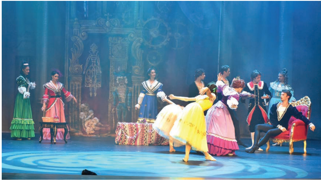
مشهد من العرض الروسي

الكويت الريادي والثقافي والحضاري وسط عالمها العربي والإسلامي. وقد بدأت اليوم أول فعاليات المهرجان خلال افتتاحه من خلال عرض مسرحي روسي عن قصة «سندريلا» التي تحاول أن تجسد الأمل في المستقبل وانتظار الخير بعد العذاب، والتطلع إلى حياة أفضل، وهذه الفتاة التي آمنت بأن تتزوج الأمير وتعيش في قصر جميل منذ صغرها إلى أن وصلت إلى مرادها وتحققت كل أمنياتها بعد صبرها الطويل وعملها الشاق.