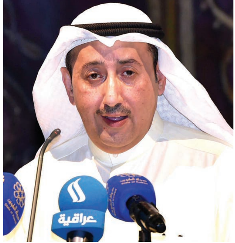
الأمين العام بالإنابة محمد العسوسي

وفي افتتاحه للمهرجان نفسه في دورته العاشرة، أكد وزير الإعلام ووزير الدولة للشباب رئيس المجلس الوطني للثقافة والفنون والآداب الشيخ سلمان الحمود أن المهرجان لم يغفل عن إدراج موضوع التسامح ضمن فعالياته، ووجوب مشاركة أبنائنا وشبابنا لرسم السياسات واتخاذ المواقف الصلبة التي تتصدى للأفكار الهدامة وتنبذ العنف بكل صنوفه وأشكاله، مشيراً إلى أن الهدف الأساس من المهرجان هو تعزيز الولاء والانتماء للوطن، إضافة إلى صقل مهارات الشباب وتنمية مواهبهم في المجالات الثقافية والأدبية والعلمية. ثم نتأمل في هذا الشأن قول وزير الإعلام: «تبرز الأهمية الإستراتيجية للثقافة الكويتية، التي حدد ملامحها المرسوم الأميري الصادر في العام 1973 بتأسيس المجلس الوطني للثقافة والفنون والآداب، والذي تركز دعائه على التخطيط الهادف والبناء، لاسيما في ظل المرحلة التي نعيشها الآن». وينظم المجلس الوطني سنويا مهرجان صيف ثقافي بهدف استقطاب الشباب وملء أوقاتهم أثناء الإجازة الصيفية بالعديد من الفعاليات التي تعمل على ترسيخ قيم ومفاهيم الانتماء والولاء للوطن وتعزيز قدراتهم بالصورة الإيجابية وصقل مهاراتهم وتنمية خبراتهم في المجالات الثقافية والأدبية والفنية والعلمية. ويتضمن المهرجان العديد من الأنشطة الموسيقية والمسرحية والتشكيلية والشعرية والتراثية إضافة إلى معرض للكتاب وندوات ثقافية.