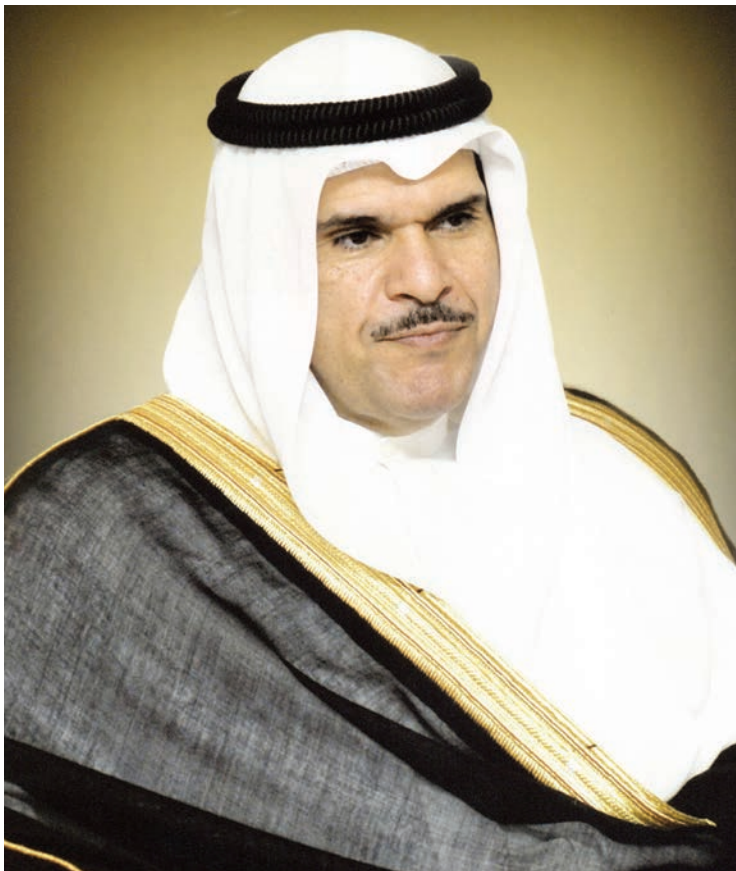
معالي وزير الإعلام الشيخ سلمان صباح السالم الحمد الصباح